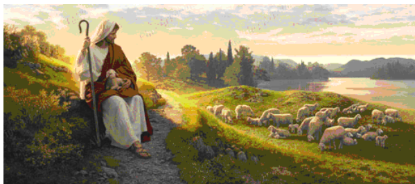
Gesù è il Buon Pastore

“Gesù Cristo è lo stesso ieri, oggi e in eterno” (Ebrei 13:8)