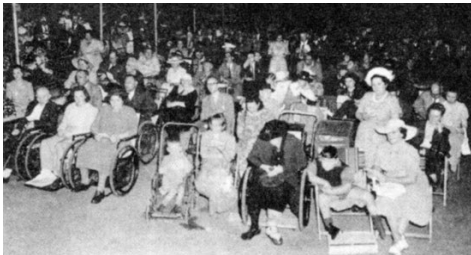
(Una fila di malati in Sud Africa per la preghiera della Fede. Tutti vennero guariti.)

Il 7 Maggio 1946 alle 23:00 egli era ritirato in un vecchio mulino per pregare e leggere la Bibbia, quando tutto ad un tratto vide una Luce entrare nella stanza dove si trovava. Si chiese chi potesse essere a quell'ora e in quel luogo sperduto, ma la Luce si faceva sempre più forte e allora comprese che non era una luce elettrica poiché stava riempiendo la casa. In quel momento sentì dei passi e dei piedi d'uomo uscire da quella Luce, apparendo una figura umana davanti a sé. Il fratello Branham rimase sbalordito ed impaurito, ma la stessa Voce profonda che lo aveva accompagnato dall'infanzia gli disse: “Non temere. Io sono mandato dalla presenza dell'Onnipotente Iddio per dirti che la tua particolare vita e i tuoi modi frantesi sono stati ad indicare che Dio ti ha inviato per portare un dono di guarigione divina alle genti del mondo. Se sarai sincero, e potrai fare in modo che le persone ti credano, niente resisterà davanti alla tua preghiera, nemmeno il cancro” . Amen!