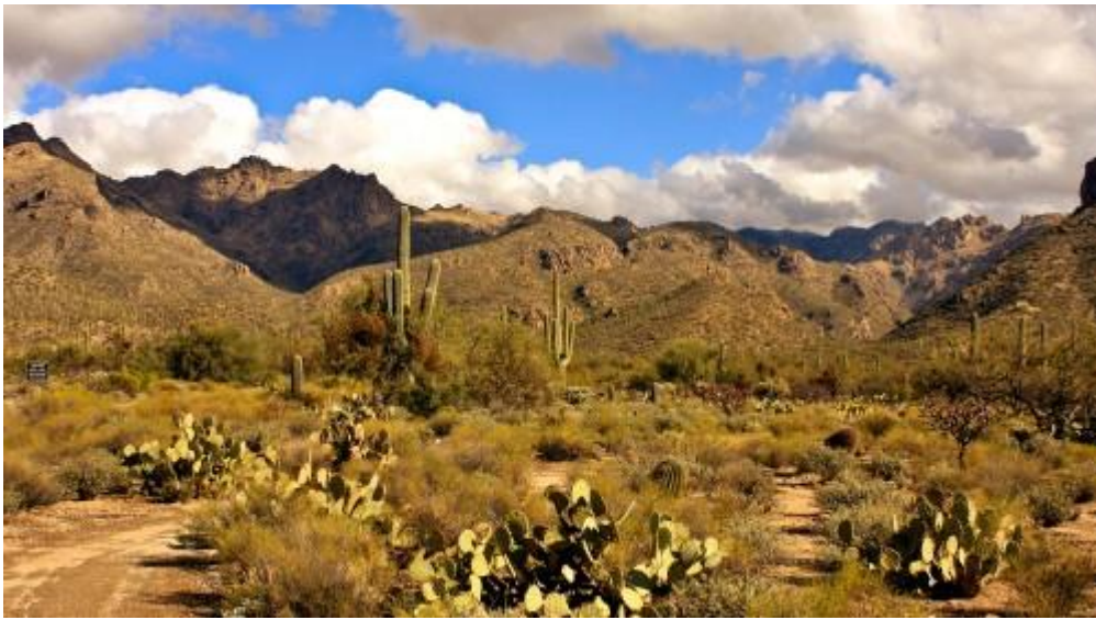
Sabino Canyon, Tucson - Arizona

Dal 12 gennaio al 27 gennaio 1963, il profeta fece una campagna di predicazioni in una dozzina di chiese nella zona di Phoenix e nella sua ultima predica, chiamata "Un Assoluto", gettò le fondamenta di quello che a breve sarebbe accaduto, collocandolo nella Parola di Dio.