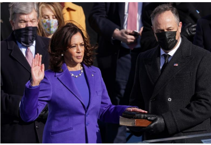
La vice presidente degli Stati Uniti Kamala Devi Harris durante il giuramento vestita in porpora reale

207. Ora, predissi, e dissi: “Ho visto sorgere una grande donna, di bell’aspetto, vestita con classe in porpora reale”. [Il porpora reale veniva secretata da una ghiandola, come liquido vischioso di colore violaceo e già nell'antichità veniva utilizzata per la colorazione delle stoffe. In età imperiale rappresentava il colore per eccellenza per questo definito reale. – Wikipedia.] E ho messo qui una piccola parentesi, “(Lei era una grande governante negli Stati Uniti; forse la chiesa cattolica.)” Una donna, qualche donna; non so se sarà la chiesa cattolica. Non lo so. Non posso dirlo. L’unica cosa che ho visto, ho visto la donna, ed era tutto.