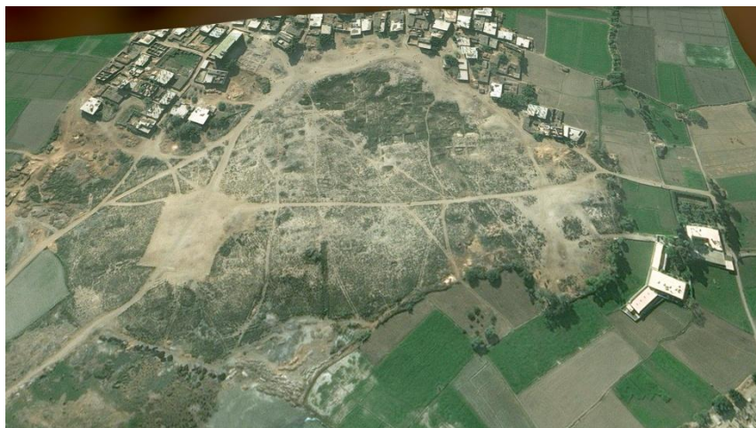
Avaris, antica città egiziana

Ora la domanda nasce spontanea, come mai in Esodo 1:11, 12:37 troviamo le città deposito chiamate Pithom e Raamses? Alcuni credono sia stato un "anacronismo", cioè un errore cronologico nell'attribuire certi fatti accaduti ad un'epoca diversa da quella in cui sono avvenuti. Però i credenti sanno che ogni Parola di Dio è ispirata dallo Spirito Santo e non ci possono essere errori (II° Timoteo 3:16). Se andiamo nella Genesi 47:11 possiamo vedere che il nome Ramses era già scritto e presente diversi secoli prima che lui venisse. Come è possibile questo? Come ogni despota quando diveniva assolutista nel suo impero, metteva il proprio nome alle città e alle cose come fece anche Stalin e altri dittatori come loro. Gli scribi che continuarono a copiare la Torah aggiornarono il punto geografico con quello più recente e quindi di Ramses.