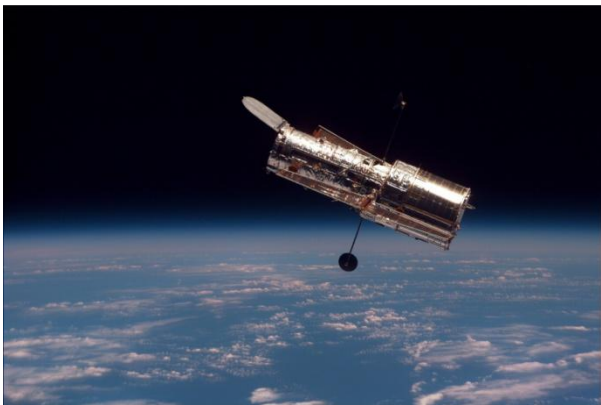
Il Cielo fotografato dal Telescopio Hubble - 8 febbraio 1994

La NASA non ha ancora risposto, ma date un'occhiata qui sotto per il nostro rapporto esclusivo sulla prima foto: