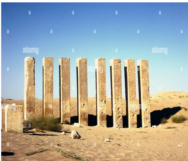
Resti del tempio del dio sole a Ma'rib

Soltanto la grazia di Dio la protesse in questo lungo viaggio. Quando un cuore vuole conoscere il Signore, non ci sono montagne che lo possono fermare (Salmo 121:1-2). Così e' anche oggi, se veramente vogliamo conoscere il Salvatore. Noi dovremmo fare di piu', visto che davanti ai nostri occhi c'e' Uno piu' grande di Salmone. Amen!