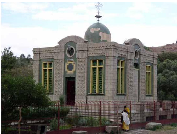
Tempio di Axum con dentro l'arca

Chi era questa Regina, che la Scrittura ce ne parla nel libro dei Re e delle Cronache? Non si conosce il nome, benché le sono stati affibbiati diversi durante i secoli, ma la Bibbia non ce lo dice. E' scritto soltanto: „ Quando la regina di Sceba sentì parlare della sapienza di Salomone a motivo del nome dell'Eterno, venne a metterlo alla prova con difficili domande. Essa giunse a Gerusalemme con un grandissimo seguito, con cammelli carichi di aromi e con una grande quantità d'oro e di pietre preziose; andò quindi da Salomone e parlò con lui di tutto ciò che aveva in cuore. Salomone rispose a tutte le sue domande, e non ci fu cosa alcuna che fosse nascosta al re e che egli non sapesse spiegare. Quando la regina di Sceba vide tutta la sapienza di Salomone, la casa che egli aveva costruito, i cibi della sua mensa, gli alloggi dei suoi servi, il servizio dei suoi camerieri e le loro vesti, i suoi coppieri e gli olocausti che egli offriva nella casa dell'Eterno, rimase senza fiato. Disse quindi al re: «Era dunque vero ciò che avevo sentito nel mio paese circa le tue parole e la tua sapienza. Ma non ho creduto a queste cose finché non sono venuta io stessa e non ho visto con i miei occhi; ebbene, non mi era stato riferito neppure la metà. La tua sapienza e la tua prosperità sorpassano la fama di cui avevo sentito parlare» (I Re 10:1-7).